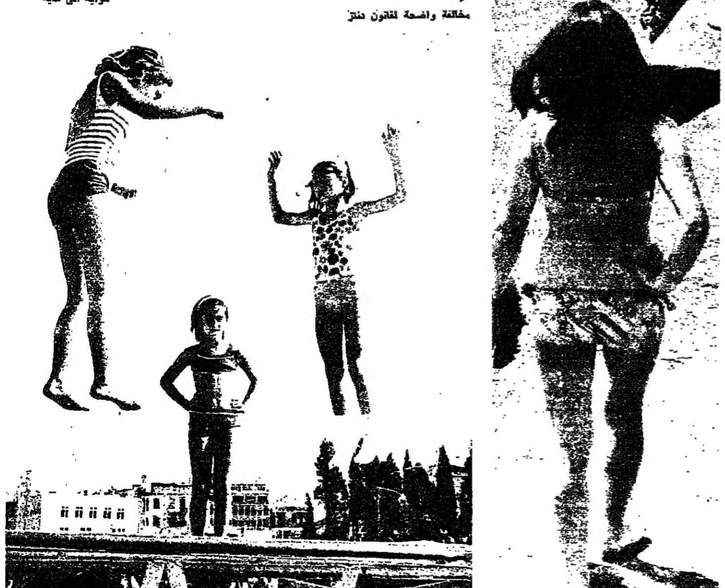
مخالفة واضحة لقانون دنتر